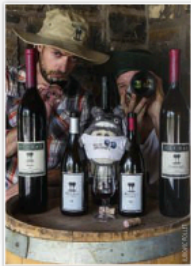
Les Wine Explorers comptent déguster 15 000 vins en trois ans.

Au Zimbabwe, où après une demi-journée de retenue à la douane pour "possession de caméras GoPro jugées dangereuses", qui seront finalement confisquées durant le séjour, les explorateurs arrivent au domaine Mutyu Winery, le plus important du pays, mais qui a fermé ses portes la veille de leur arrivée ! Il ne reste plus qu'un domaine à